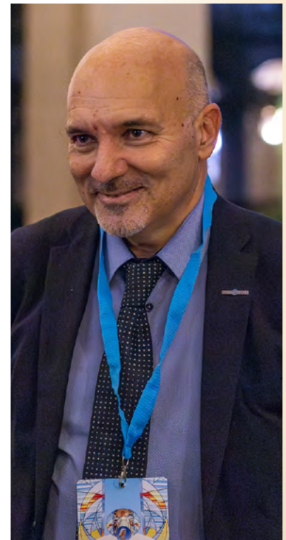
На фото: Вітторіо Віккарді, Президент Всесвітньої Родини Радіо Марія

- Наступними країнами, які має поширити сигнал Радіо Марія будуть Південна Африка, Шрі-Ланка і, можливо, Пакистан. Початок мовлення Радіо Марія в нових країнах завжди є викликом. Потрібно створити студію, знайти команду працівників, встановити передавачі, отримати частоти. Ця підготовча робота може тривати від одного до двох років, адже не завжди вдається усе реалізувати одночасно. Терміни залежать і від економічної та політичної ситуації в кожній країні, а також від видачі дозволів на мовлення. Однак, я сподіваюсь, що саме в цих країнах незабаром з'явиться Радіо Марія.